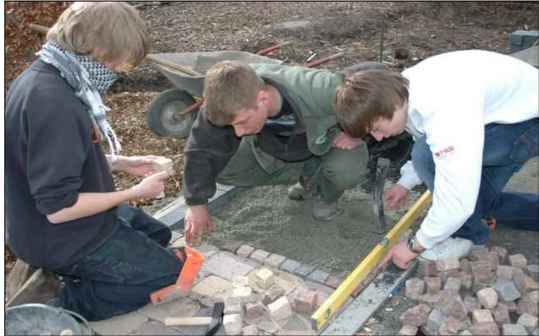
Garten- und Landschaftsbau

Kennenlernen von Berufen / Berufsfeldern in der Schule vorgestellt durch Praktiker