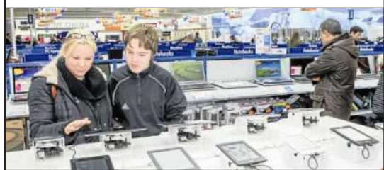
Stammkunden des Expert-Media-Parks konnten sich bereits am Mittwochabend einen Überblick über das Angebot auf 1600 Quadratmeter Verkaufsfläche machen (Foto oben). Das Sortiment in dem Neubau am Hengelplatz stieß auf riesiges Interesse. Der offizielle Startschuss fiel gestern Morgen. Am Mittag wurde es ruhiger und die 20 Mitarbeiter konnten aufatmen.