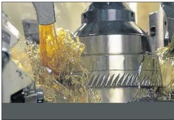
Schmierstoffe können eine saubere Sache sein.

Auf pflanzlichen Rohstoffen basierende Raffinate ersetzen