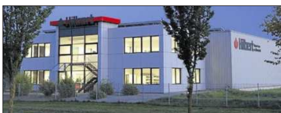
Die Hilbert Mineralöl GmbH.

Zu den Produkten, die auf dem Firmengelände unweit des Postverteilzentrums abgefüllt werden, gehören sowohl die Schmierstoffe der Automobilbranche als auch die große Zahl der Industrie- und umweltschonenden Schmierstoffe. Das Wichtigste beim