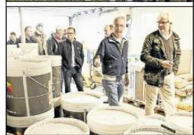
Impressionen der Farbrat-Tagung bei Kudraß.